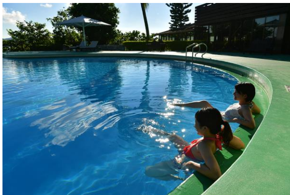
アクアピラティス

さまざまなおもてなしを上手に利用して、ゆったりと夏のバカンスをお楽しみください。